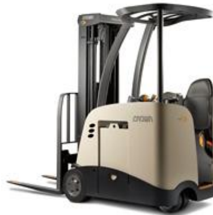
Figure 2. Chariot élévateur