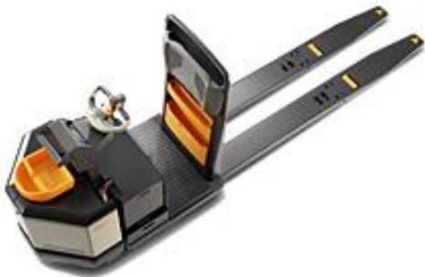
Figure 3. Transpalette (simple ou double)