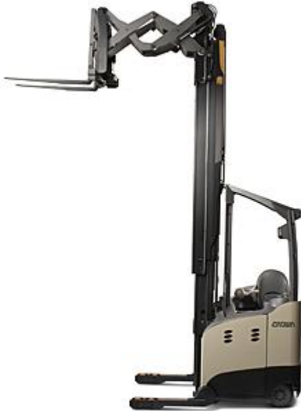
Figure 1. Monte-charge